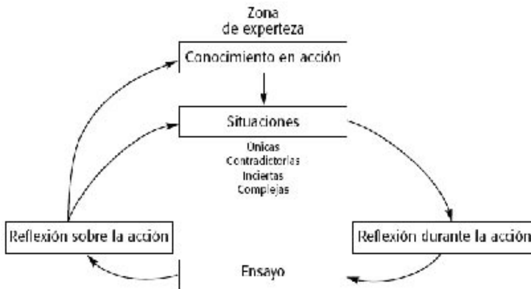
Esquema que representa el aprendizaje a partir de la práctica profesional según D. Schön (modificado de Davis D.A. & Fox R.D., 1994

“Según el contexto y el profesional, esa indagación puede tomar la forma de una resolución de problemas sobre el terreno, o bien puede aparecer como construcción de teoría o reevaluación del problema, de la situación.”