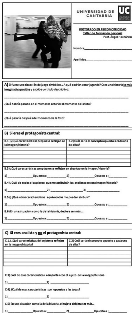
Grafico 1- Reproducido de Hernández, A (2017). Psicomotricidad vivenciada. Jugando con metáforas. (En prensa)

Véase el ejemplo del instrumento en el gráfico 1: